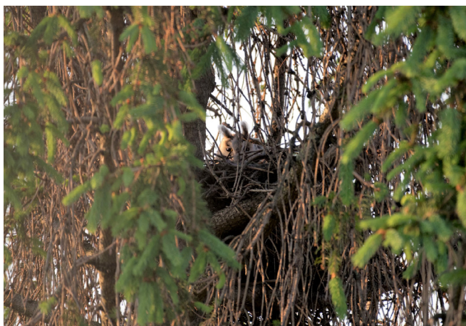
9 juni: vrouw ransuil broedend

V Vanmorgen mochten er twee kuikens over de rand van het nest naar ons kijken. Ze kwamen onder de borst van moeder vandaan, die het tevreden liet gebeuren. Het waren er dus twee tegelijk, maar we blijven kijken of we er meer tegelijk gaan zien. Gisteravond heb ik vanaf 23.15 uur een uur onafgebroken zitten kijken, waarin het vrouwtje enige tijd niet aanwezig was. Wel relatief veel beweging in het nest. Elke dag is het mannetje in de naburige conifeer met enige moeite te zien.