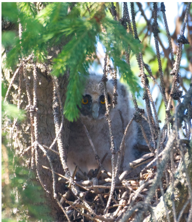
24 juni: drie uilskuikens te zien op het nest