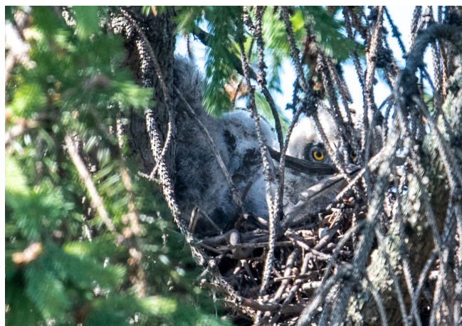
24 juni: drie uilskuikens te zien op het nest