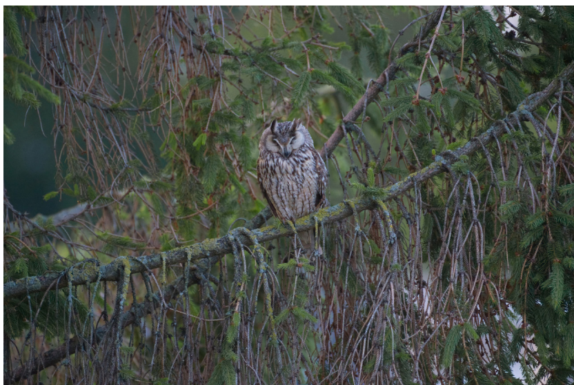
5 juli, vrouw ransuil rustend in een boom