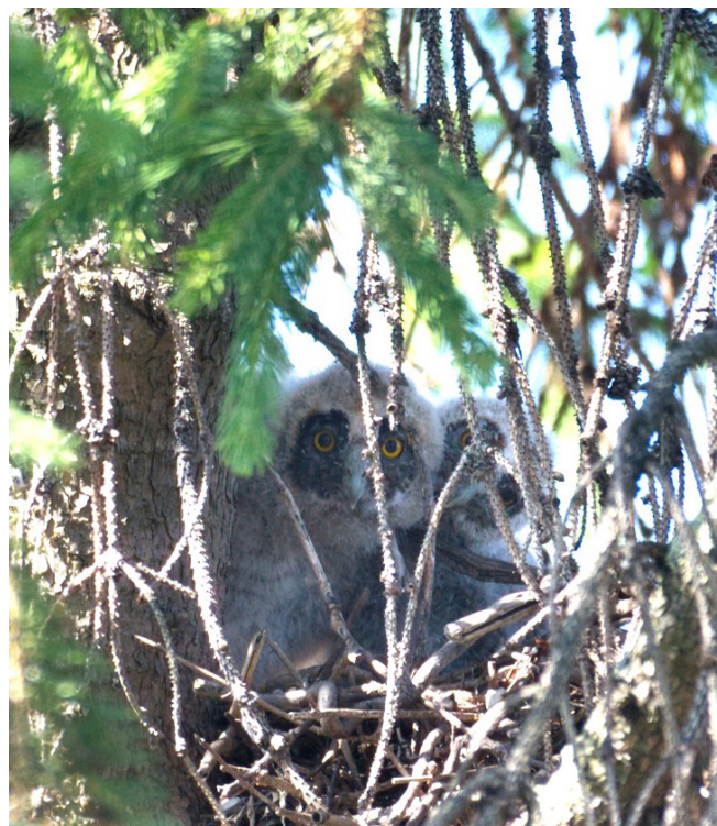
24 juni: ja hoor, het zijn er echt drie!